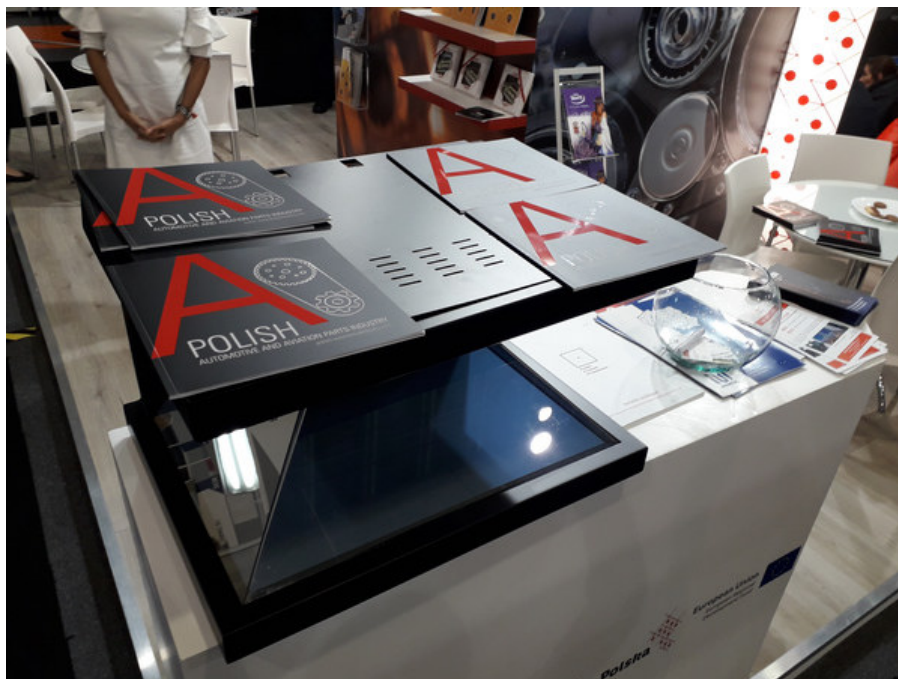
Piramida holograficzna przyciągała uwagę zwiedzających

Przez trzy kolejne dni od 11 lipca 2018 r. w Mieście Meksyk odbywały się największe targi motoryzacyjne w Ameryce Północnej. Bieżąca edycja INA PAACE zgromadziła ponad 500 wystawców z całego świata, których stoiska odwiedziło ponad 20 000 osób. Dużym zainteresowaniem cieszyło się polskie stoisko zorganizowane przez Polską Agencję Inwestycji i Handlu.