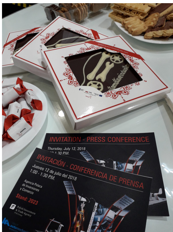
Na polskim stoisku zorganizowano briefing prasowy